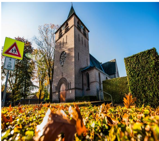
De Knegselse kerk waarvoor anno 2020 een andere bestemming wordt gezocht