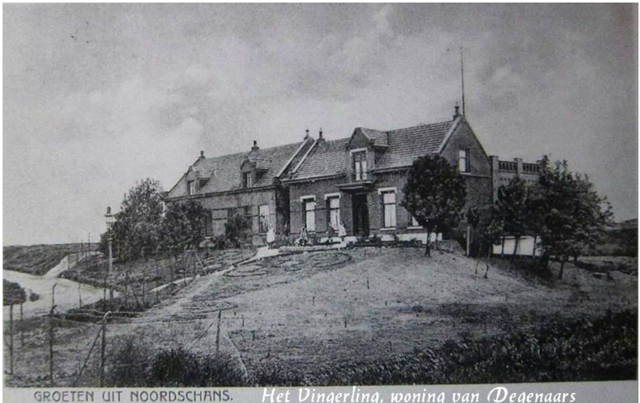
GROETEN UIT NOORDSCHANS. Het Vingerling, woning van Degenaars

In het begin zeiden ze; we hebben hier in de buurt nog 30 tanks, een paar dagen later waren het er nog 11 en nog een dag later 4 stuks. Op een keer namen de jachtvliegtuigen het huis en schuur van R.B. onder vuur. Daar was een Rode Kruispost gevestigd er waren daar nogal wat activiteiten en had men dit opgemerkt. Tussen de beschietingen door werd er nog een paard met wat vee uit de brandende schuur gehaald door A. van B. die daar kortbij in een schuilplaatsje zat. Dit was een brutaal stukje om, terwijl de jagers zich hergroepeerde voor de volgende aanval, zich in een brandende schuur te begeven voor het redden van dieren. Toen na de aanval vader buiten keek zag hij dat de boerderij van B. het mikpunt was geweest en in brand stond, bij ons stond alles nog overeind. Hij vertelde het met tranen in de ogen. Op een andere dag, vader was boven in de schuur om hooi af te gooien, toen was daar weer een luchtaanval, onverwachts. Het doel was nu een Duitse vrachtauto welke half in de garage van Degenaars stond.