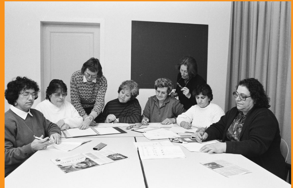
Buitenlandse vrouwen krijgen les in het Buitenlandse Vrouwen Centrum (1989)