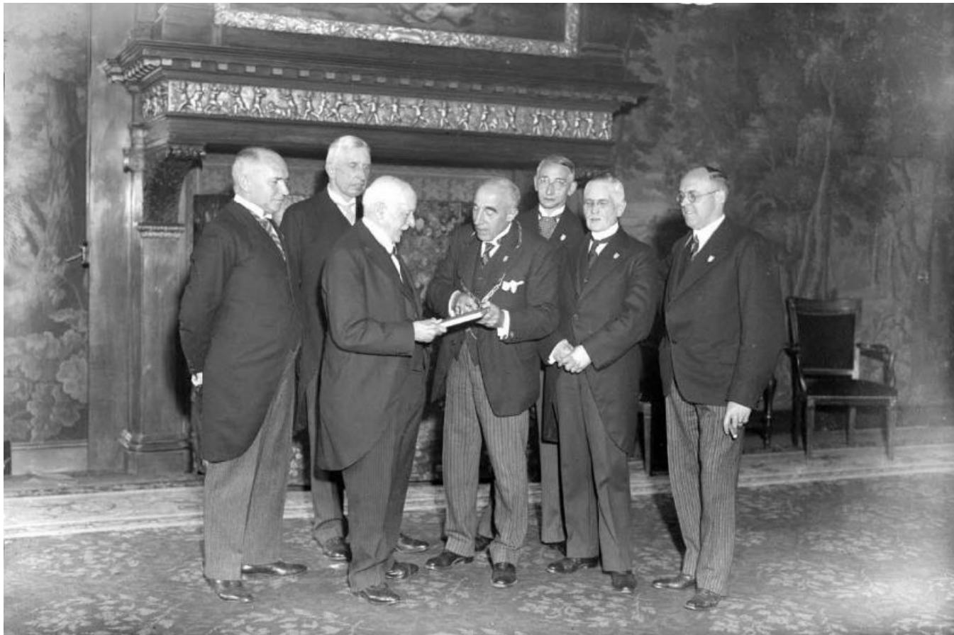
Uitreiking gedenkboek 's Hertogenbosch 1185-1935 (1935)