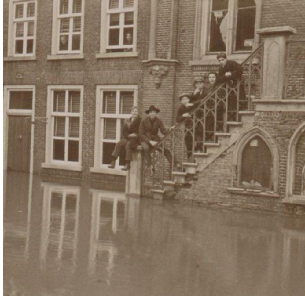
Cuijk in 1926