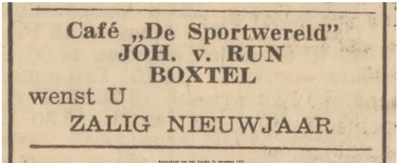
Nieuwsblad van het Zuiden, 31 december 1951