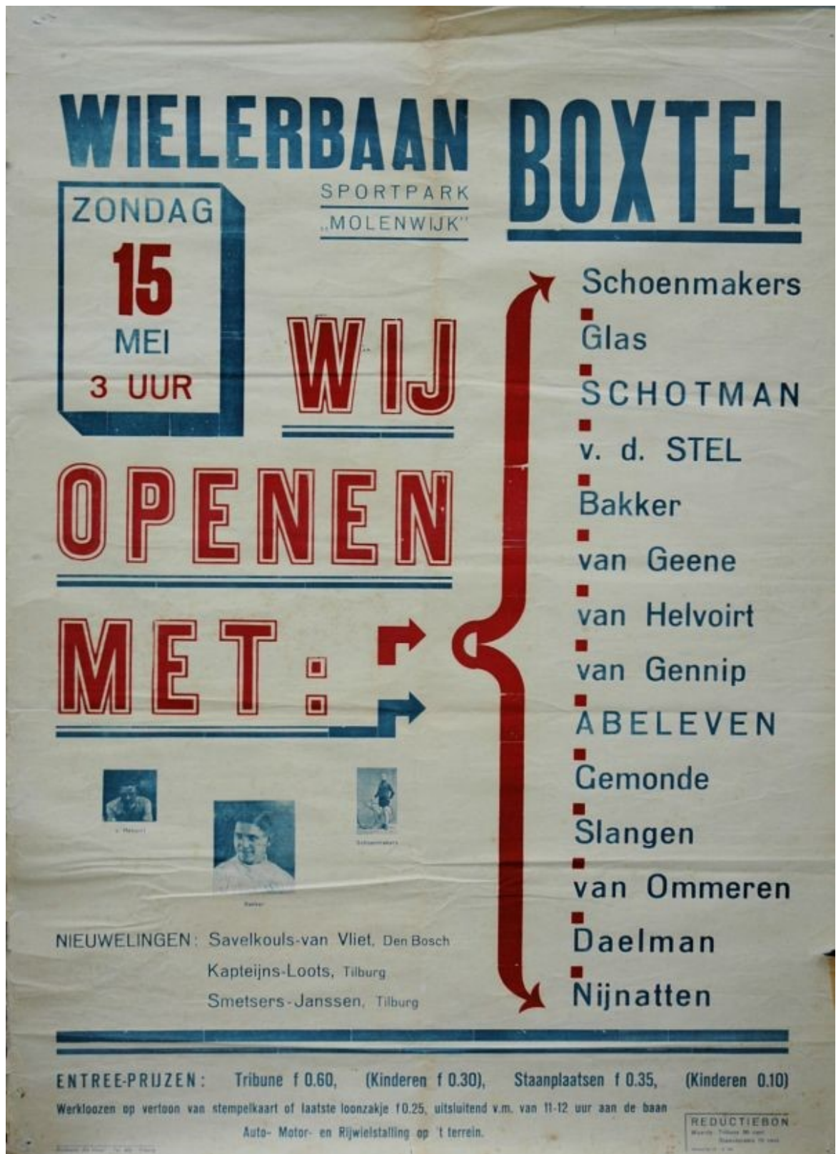
Affiche van de openingswedstrijden van het Boxtelse wielersbaanseizoen 1938, op zondag 15 mei dat jaar.