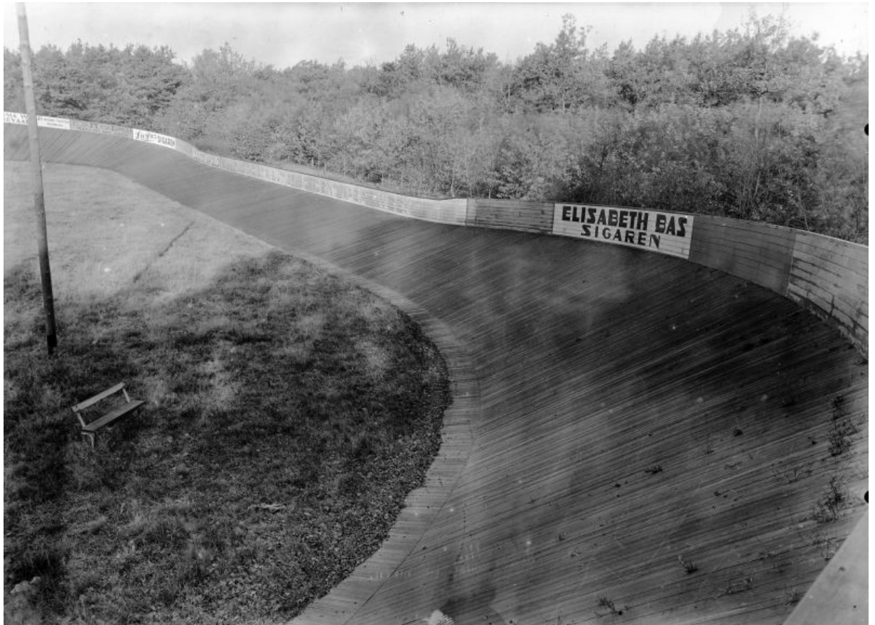
Bovenaanzicht van de Boxtelse wielersbaan, hier reeds voorzien van een houten vloer