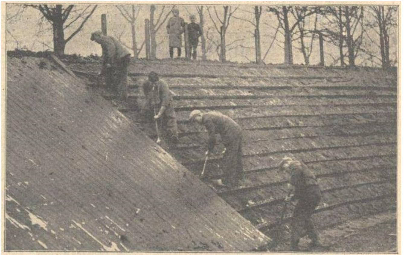
December 1940, de afbraak van de Boxtelse wielersbaan is begonnen