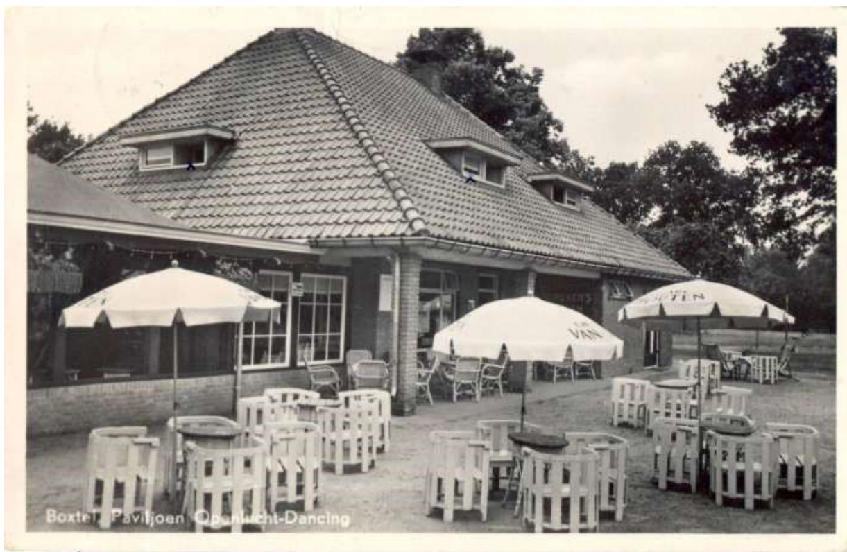
Paviljoen Molenwijk nabij het Leysenvoer. Openlucht-dancing, café-restaurant-pension. Uitbater C.A. Robben