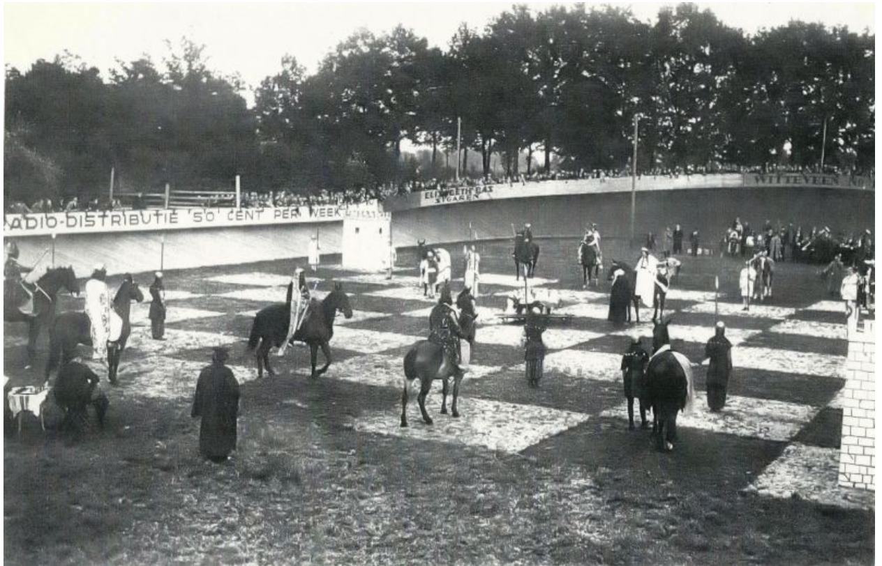
Levend schaakspel op middenterrein van de Boxtelse wielerbaan in 1938