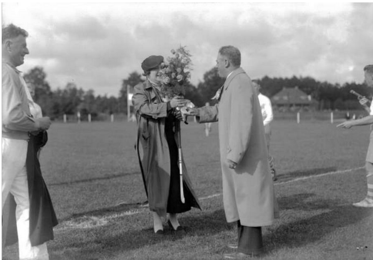
Opening hockeyveld Mep in park Molenwijk op zondag 27 september 1936, op het moment dat ernaast de wielervebaan al ruim 2 jaar actief is

De wielervebaan krijgt een plaats dicht in de buurt van de Eikenlaan. Een stukje verderop richting Essche Heike (weg) komt, het eerste MEP-hockeyveld, aangelegd door de eigen leden. Omstreeks 1956-'58 krijgt Mep een uitbreiding in de vorm van een trainingsveld. Daartoe wordt dan een perceel dennenbos geroooid, gelegen tussen het dan bestaande hockeyveld en Essche Heike.