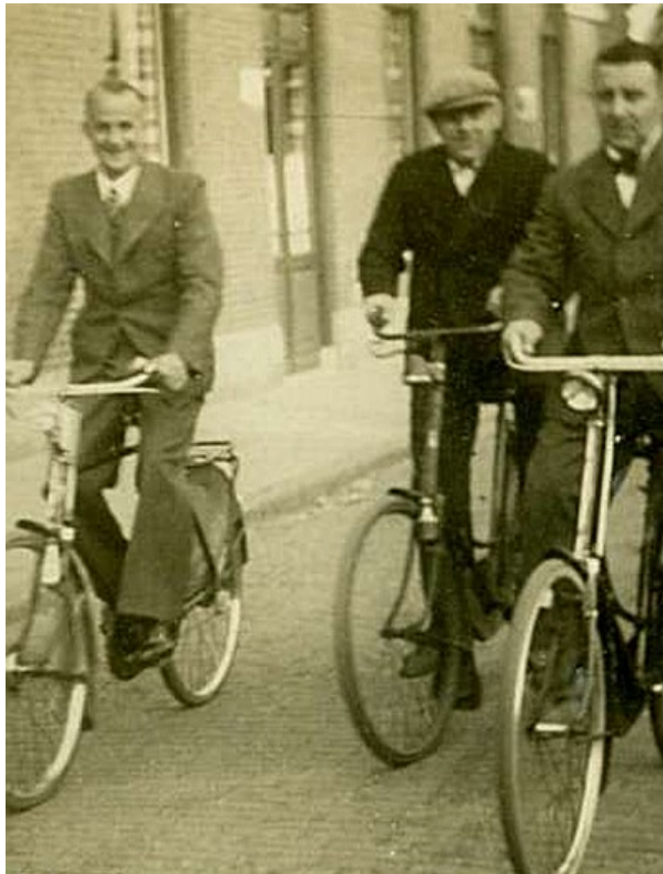
Pastoor Erasstraat Boxtel omstreeks 1935-'40.