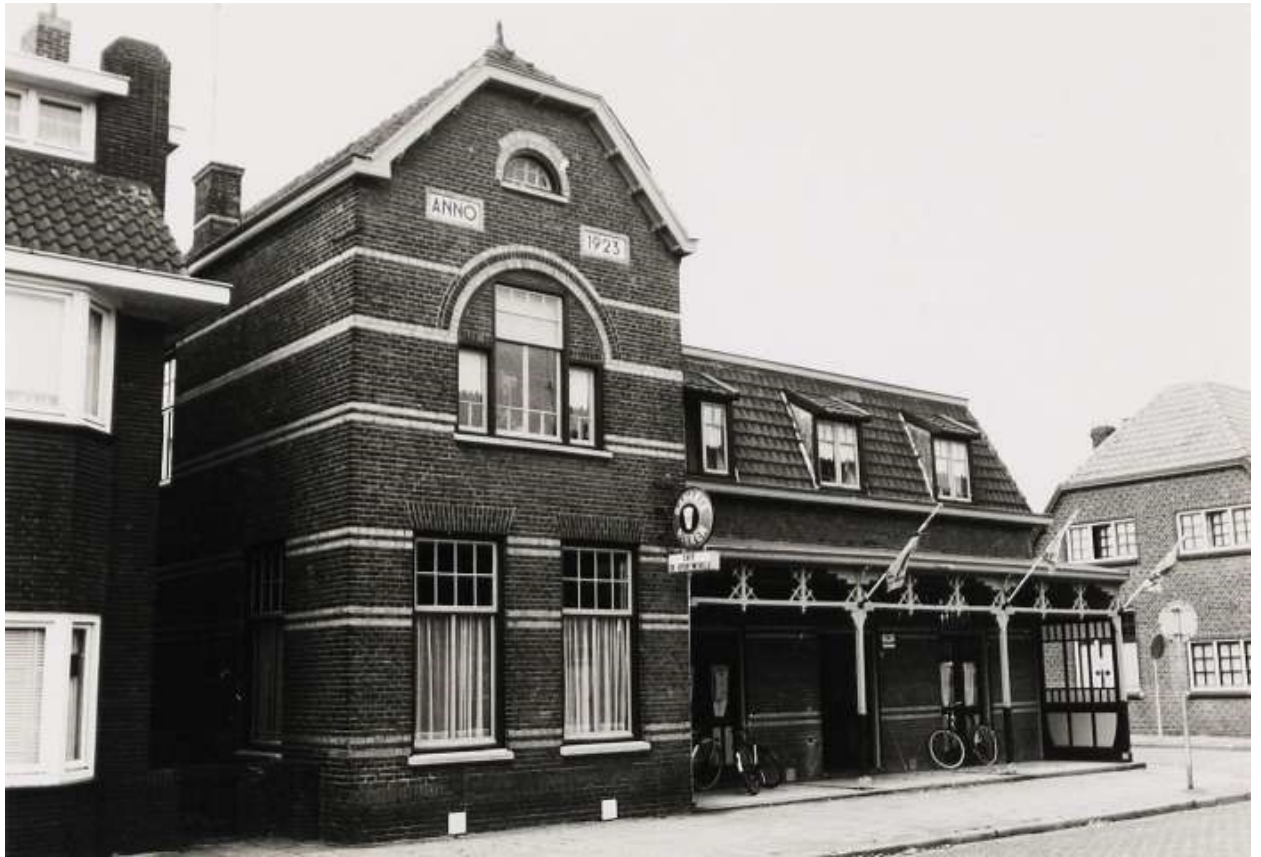
Café De Sportwereld, Stationsstraat Boxtel, 1980

Andere bestuursleden van Rapide zijn de heren: