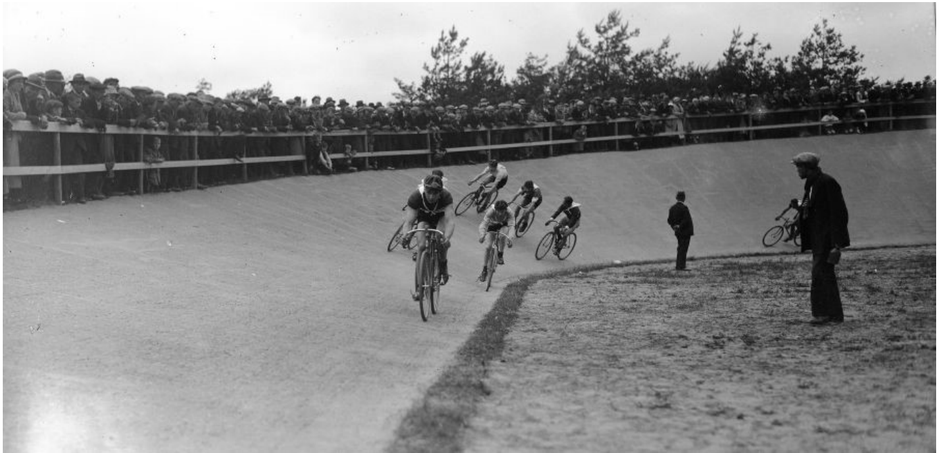
Beeld van de wedstrijden op de dag van opening, maandag 21 mei 1934