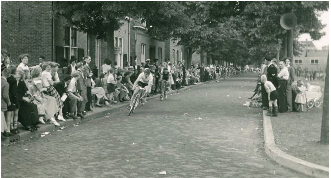
Ronde van Boxtel 1952. Remmers in Kasteellaan naderen bocht naar Prins Hendrikstraat