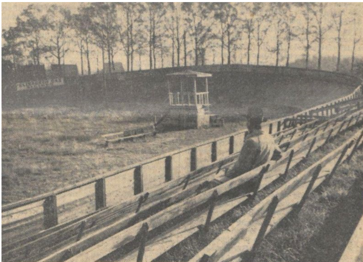
November 1940, kort voor de afbraak van de baan

Vrijdag 3 januari 1941 wordt een grote hoeveelheid hout, afkomstig van de gesloopte Boxtelse wielerveerbaan in het openbaar verkocht. Woensdag 1 en donderdag 2 januari zijn er op de wielerveerbaan kijkdagen. De verkoping vindt plaats in het nabijgelegen Paviljoen Molenwijk , gelegen aan de rand van het Leysenvan en zal geschieden door te Amsterdamse veilingmeester Chr.J. Bolle , zulks ten overstaan van de Boxtelse notaris P. Mertens 33 .