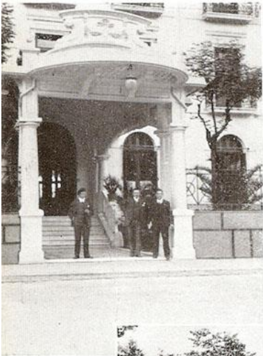
Hotel „Continental Palace” te St. Sebastiaan (Spanje).