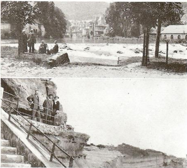
Boven: De rivier „de Gave”, die door de beroemde bedevaartplaats Lourdes stroomt, welke plaats vanaf Eindhoven in één dag met den Ford werd bereikt.