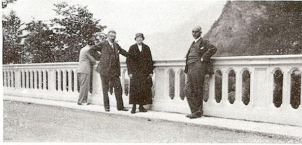
De brug over de Gave met zijn watervallen en rotsblokken. De bochtige weg, enkel berijdbaar door ervaren chauffeurs, voert naar de „Cirque de Gavarnie”, het beroemdste punt der Pyreneeën.