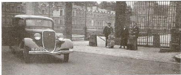
Ingang fraai kasteel te Fontainebleau. — De V-8 cyl. de Luxe waarmede de prestatie werd volbracht.

Na door de Belgische douanen even te zijn opgehouden, reden we om 3½ uur de Lommelsche brug over en bereikten om 4½ uur Leuven.