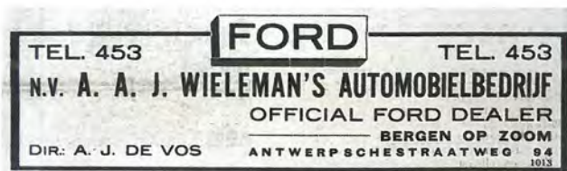
Afb. 10. Advertentie bij "100 jaar Synagoge" in het Centraal blad voor Israëlieten in Nederland.