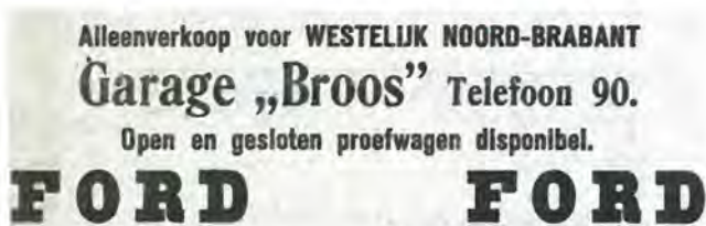
Afb. 1. In 1920 had Garage Broos in Roosendaal nog de alleenverkoop van Fordautomobielen voor westelijk Noord-Brabant. Advertentie in De Grondwet van 27 maart 1920, www.delpher.nl