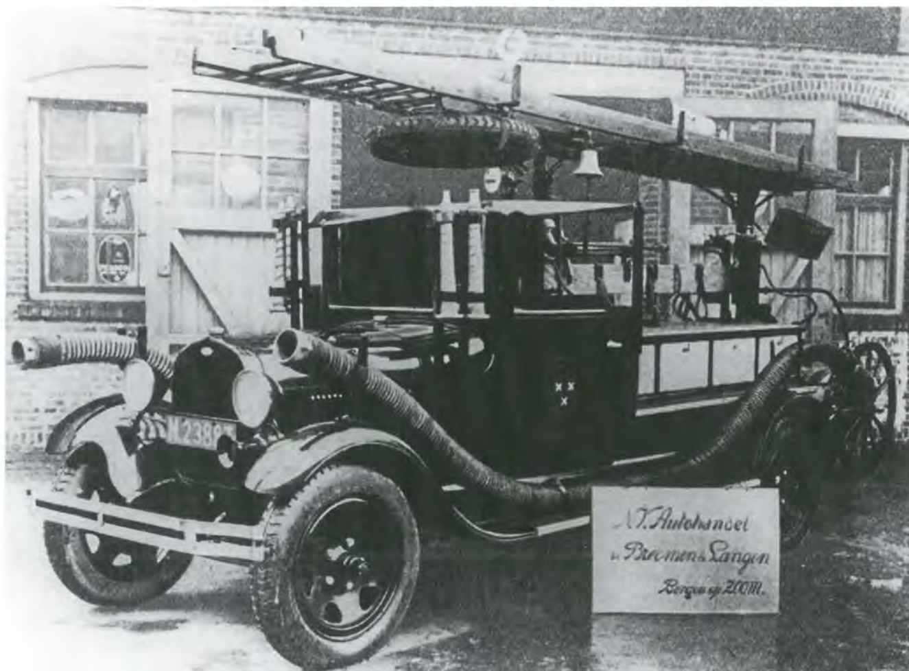
Afb. 8. Motorspuitwagen van de Bergse brandweer met carrosserieopbouw door de N.V. Autohandel Van Breemen & Langen, op een chassis van een Ford TT. Het kenteken was afgegeven in 1929.