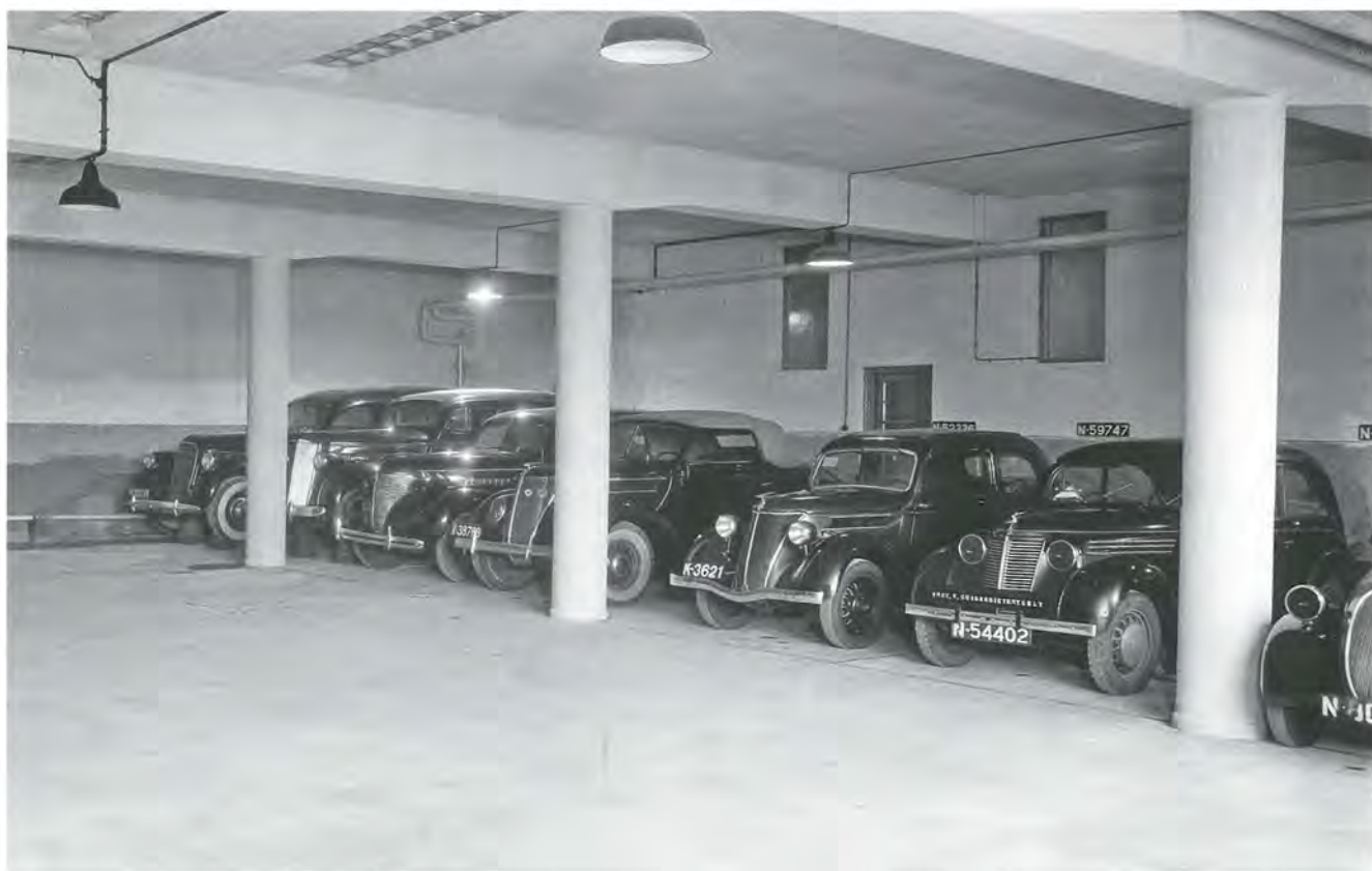
Afb. 19. De Difogaparkeerkelder met personenwagens die ter beschikking van de bezetter moesten blijven, circa 1942.