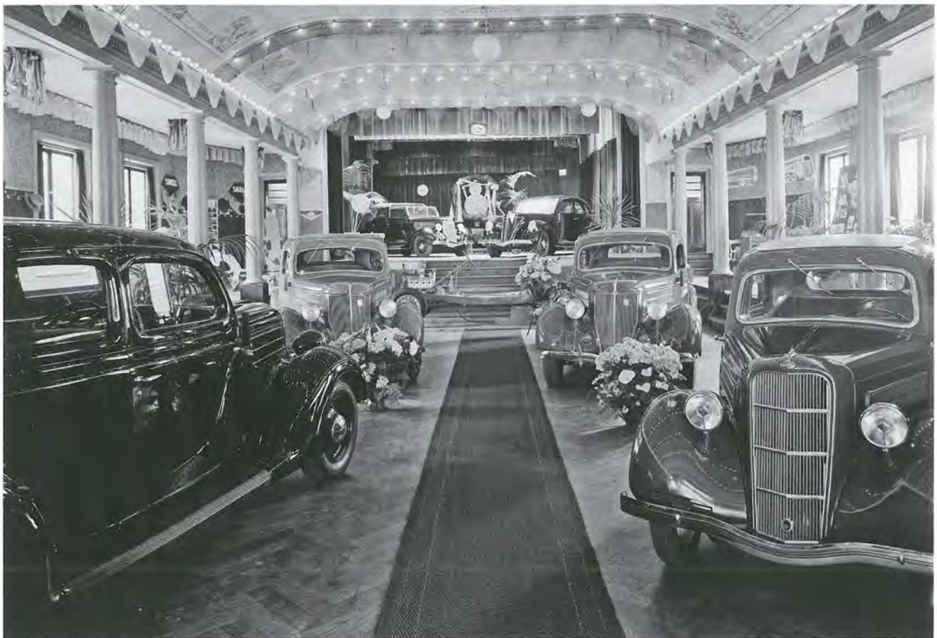
Afb. 13. Tentoonstelling van Ford automobielen in de Korenbeurs, georganiseerd door de Difoga in juni 1936. Achteraan, op het podium, staat een lauwerkrans met de door Ford V8-modellen gewonnen prijzen in de Rally van Monte Carlo van dat jaar. Aan deze rally had Frits Diepen zelf in een Ford V8 met veel succes deelgenomen. Links van de lauwerkrans een Ford V8 vierdeurs cabriolet en rechts een Lincoln Zephyr.

Vanwege de grote populariteit van Ford werd er anderhalf jaar later op dezelfde locatie opnieuw een tentoonstelling ingericht. Bij die gelegenheid vond de presentatie van het nieuwe luxemodel, de Lincoln Zephyr plaats. Deze wagen kreeg een prominente plaats op het podium (afb. 13). Uniek voor die tijd was ook de zogenaamde Forddokter een diagnose-apparaat avant-la-lettre, waarmee diverse storingen vastgesteld konden worden. 35 Ook de klandizie op de eilanden Tholen en Sint-Philipsland werd niet vergeten. Van 4 tot en met 6 november van dat jaar hield Difoga in hotel Hof van Holland in Oud-Vossemeer een tentoonstelling van Fordsontractoren en Ford V8-personeel- en vrachtwagens. Filmvoorstellingen werden er voorts nog gegeven in hotel Zeeland te Tholen, in het hotel van Pieter J. van Iwaarden in Sint-Maartensdijk en in het hotel van Frans Rijnberg in Sint-Annaland. 36