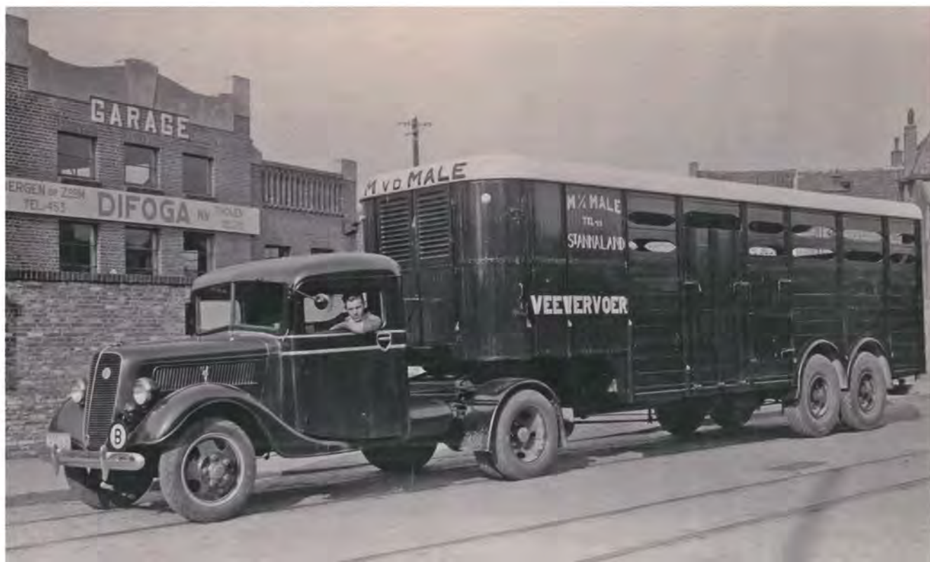
Afb. 17. Een Ford V8-truck met oplegger uit 1937 van Van der Male uit St. Annaland voor de vestiging van Difoga aan de Eendrachtsweg te Tholen.

Ondanks dat de verkoop van auto's helemaal stil lag gedurende de Tweede Wereldoorlog en er nauwelijks gereden werd vanwege de brandstofschaarste, stonden bij Difoga in 1941 toch 32 personen op de loonlijst. Dat had alles te maken met het gebruik van de faciliteiten door de afdeling Heeres Kraftfahr Park (HKP) van de Duitse Wehrmacht . Die benutte de goed geoutilleerde garage voor het onderhoud van het eigen wagenpark. Deze werkzaamheden vonden