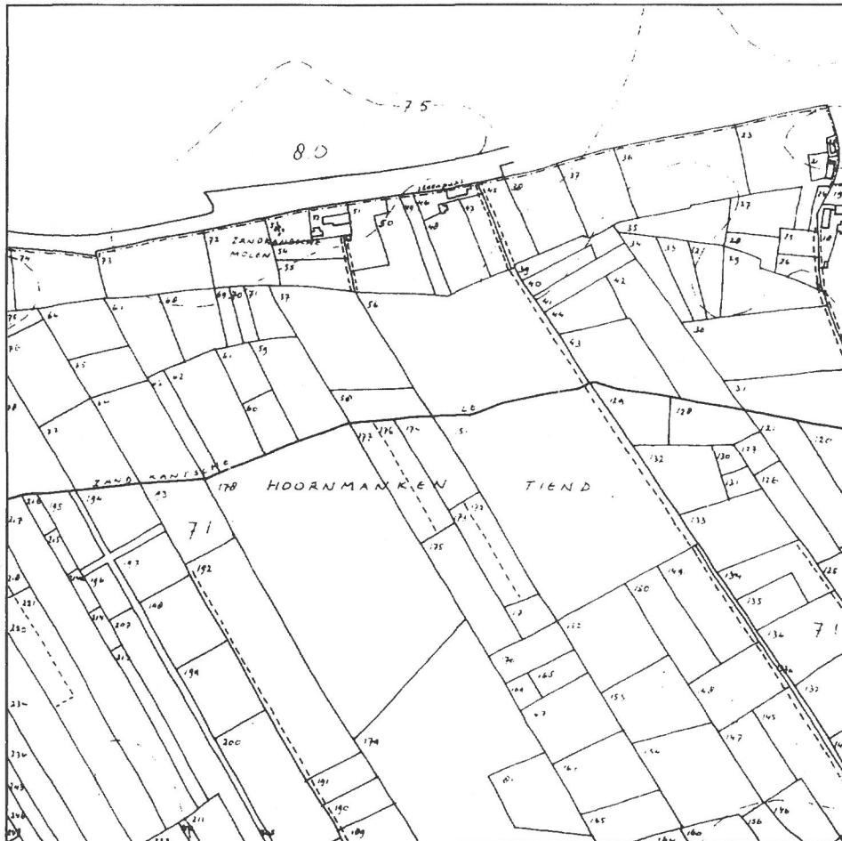
Oorspronkelijke minuutplan van het kadaster van 1832, gedeelte van Udenhout, sectie C.