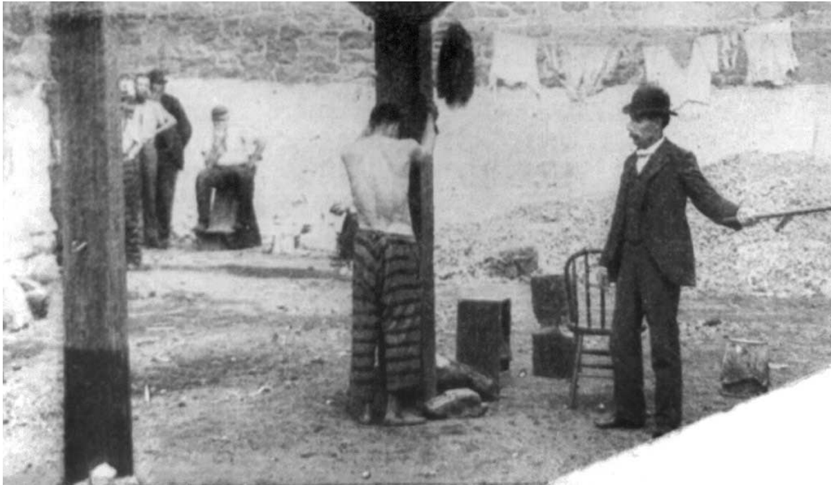
Geseling van een gevangene in Delaware

Het dossier bevat nog de volgende verklaring: “Heden de 14 november 1845 op het middaguur, hebben wij griffier van het Provinciaal Gerechtshof in Noord Brabant zich bevindend in een der zalen van het stadhuis van Den Bosch gezien dat Johannes Stupers bij arrest van de genoemde Hove van 23 mei 1845 veroordeeld tot de straf van geseling met de strop om de hals aan de galg vastgemaakt en een gevangenisstraf gedurende 20 jaar, de hem opgelegde schavotstraf heeft ondergaan op een schavot opgericht op de Markt te Den Bosch.”