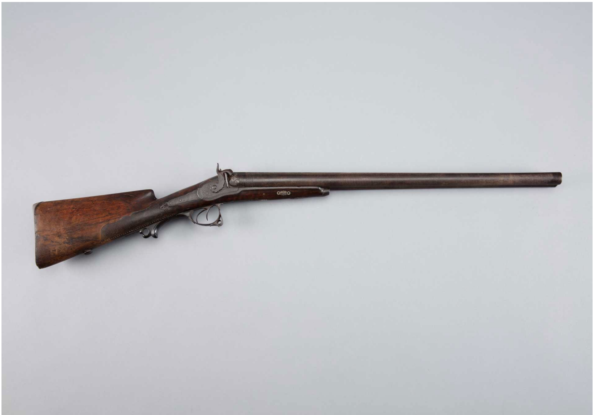
Dubbelloops geweer (W1922,)